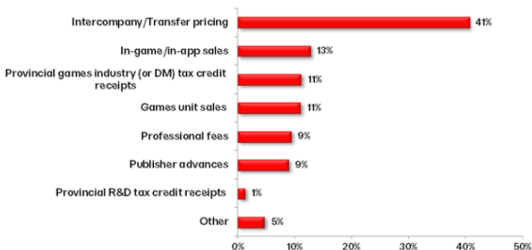
BREAKDOWN OF REVENUE EARNED BY CANADA'S VIDEO GAME COMPANIES (% OF TOTAL REVENUE)

Composizione del fatturato delle aziende di videogiochi canadesi (% del fatturato totale)