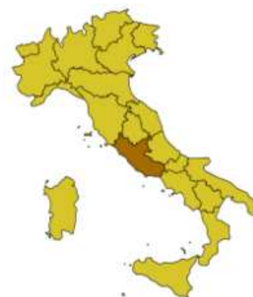
Gruppo regionale del Lazio

Il presente numero è dedicato alla DIRETTIVA SERVIZI realizzato in collaborazione con il Settore Legislazione d'Impresa di Confcommercio.