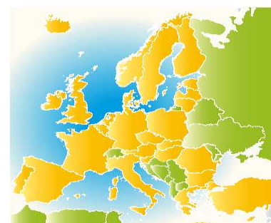
La rete Enterprise Europe Network

http://www.enterprise-europe-network.ec.europa.eu/index_en.htm